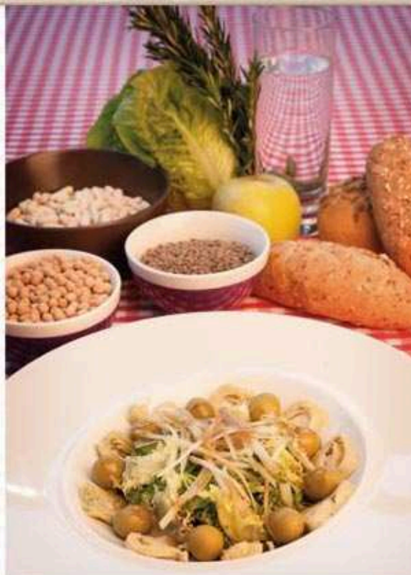
* Ensalada de inverno

Sopa de peixe con arroz Queixo fresco (45 g) con 2 pasas Pan