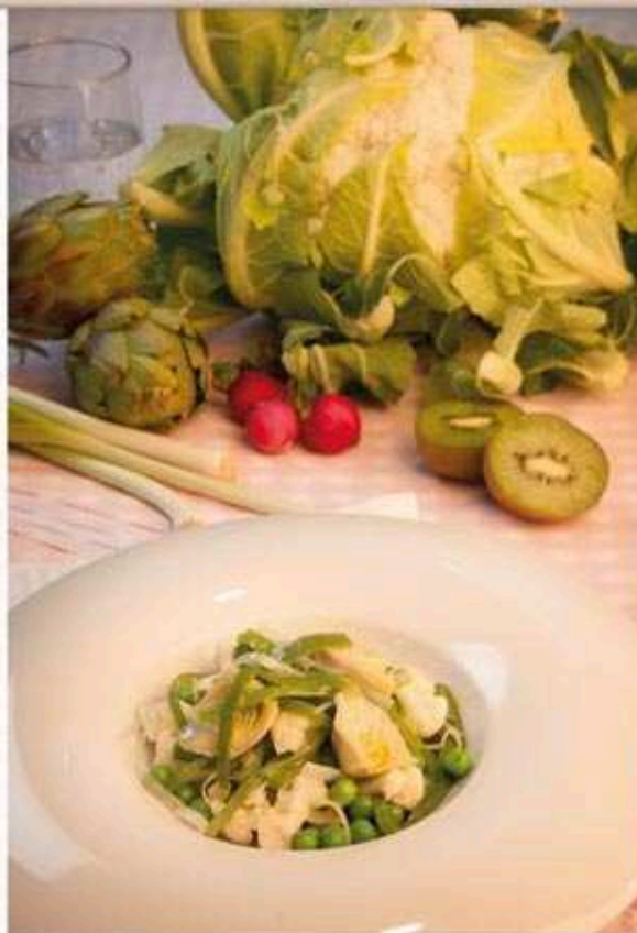
* Minestra de verduras