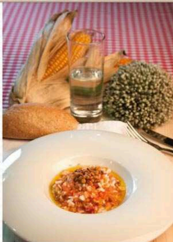
* Lentellas estufadas con arroz

Filete pequeno de pescada Tomate asado ao forno Pan