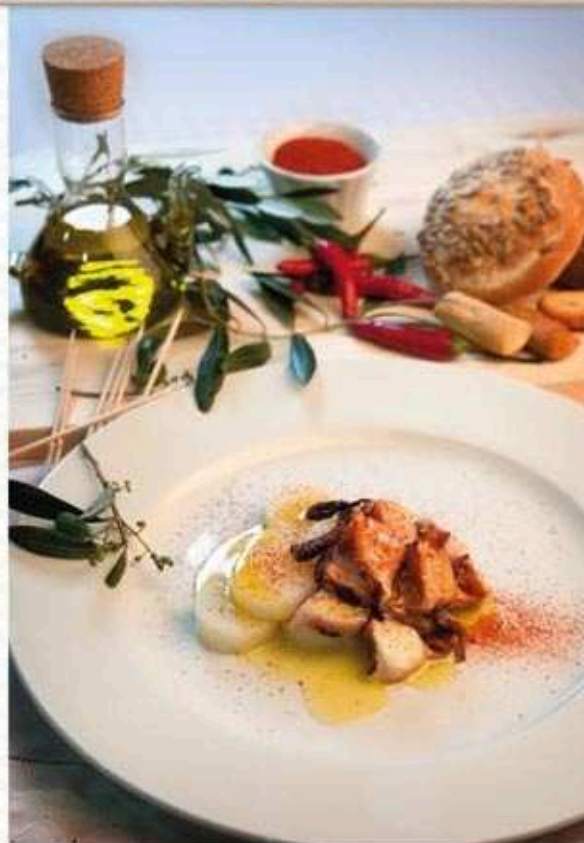
* Polbo á feira con patacas

Filete de tenreira á prancha con gornición de arroz e hortalizas ao vapor 2 ameixas verdes Pan