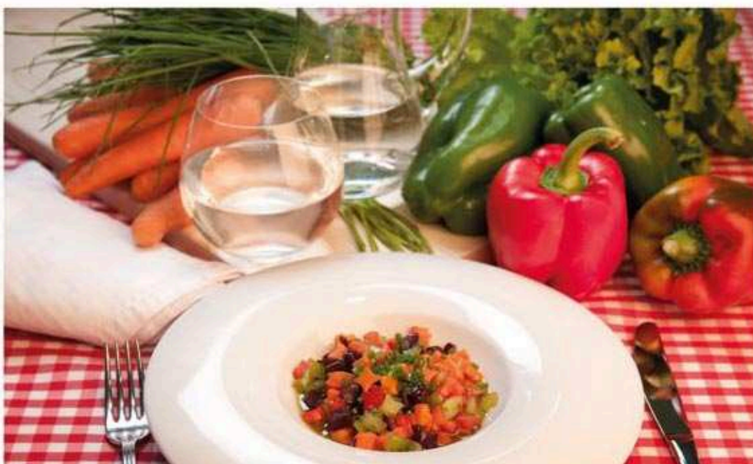
* Ensalada de cenoria

Ingredientes: 100 g de cabaza, 100 g de pataca, 90 g de leite, 75 g de cenoria e aceite.