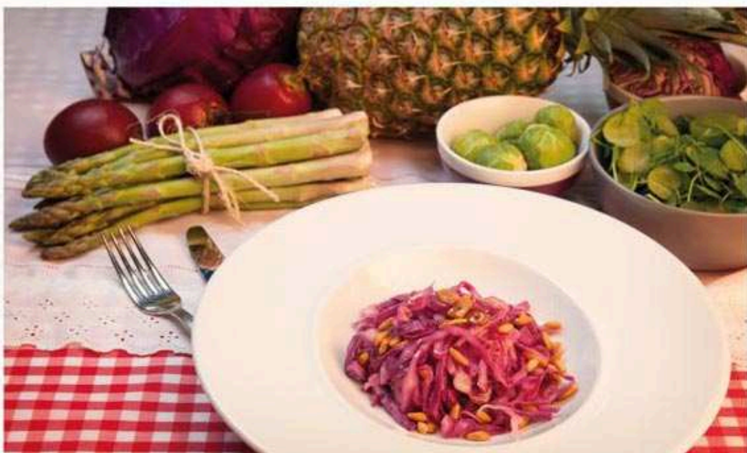
* Col lombarda con piñóns

Ingredientes: 60 g de pan, 50 g de queixo e 50 g de marmelo.