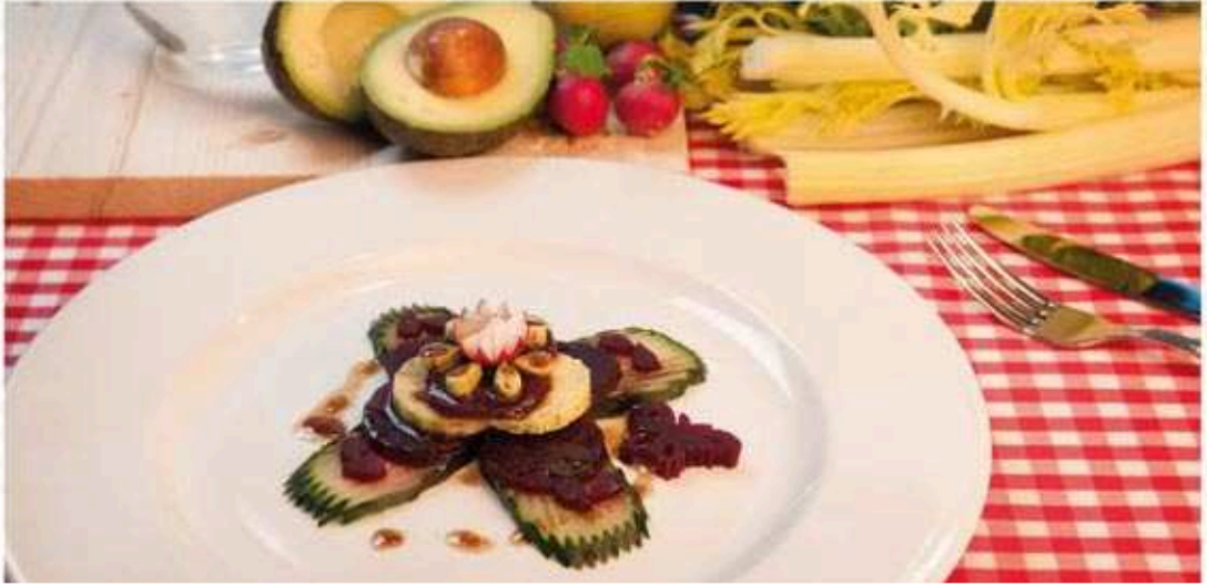
* Ensalada de ravos, remolacha, cogombro e aguacate

Ingredientes: 150 g de tomate, 50 g de pasta integral, 6 olivas e aceite.