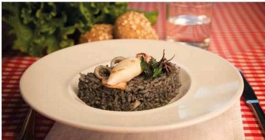
* Arroz negro con sepia e luras

Filete de porco magro e coles de Bruxelas ao vapor. Ingredientes: 75 g de filete de porco, 50 g de coles de Bruxelas e aceite.